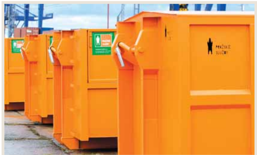
NOVÉ ZPROVOZNĚNÉ SBĚRNÉ DVŮRY V DOLNÍCH MĚCHOLUPECH

Už dnes se tam neteží ani nekácí stromy, a to ani při probírkách, a bude to platit i do budoucna. Jde o porosty po celém území