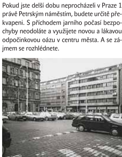
PETRSKÉ NÁMĚSTÍ před proměnou.

Pokud jste delší dobu neprocházeli v Praze 1 právě Petrským náměstím, budete určitě překvapeni. S příchodem jarního počasí bezpochyby neodoláte a využijete novou a lákavou odpočinkovou oázu v centru města. A se zájmem se rozhlédnete.