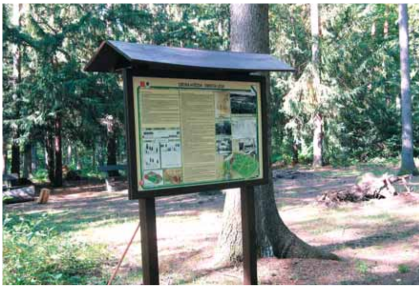
INFORMAČNÍ TABULE na naučné stezce ve Hvězdě.

V roce 2007 byla za finanční podpory Magistrátu hl. m. Prahy v oboře Hvězda otevřena naučná stezka (NS), věnující se všem zajímavostem, které na vás v tomto lesním areálu čekají. Na přibližně čtyřech kilometrech je připraveno celkem čtrnáct zastávek s informačními tabulemi. Trasa NS není v terénu speciálně vyznačena, ale na každé tabuli je plánec s vyznačením jednotlivých zastávek. Svoji naučnou procházku tak můžete začít kdekoli. Oficiální začátek NS je u Libocké brány, nedaleko domku, který byl dříve určen místnímu oborníkovi. Další zastávky naleznete u cest především po obvodu obory. Stezka vás tak zavede i do míst, kam obvykle návštěvníci Hvězdy nezamíří, ti se obvykle soustředí na středo-