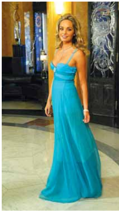
MISS WORLD TAŤÁNA KUCHAŘOVÁ