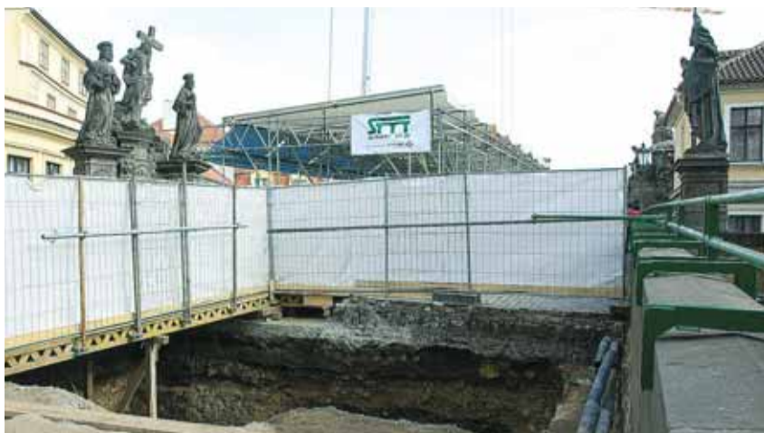
VÝMĚNA DLAŽBY A IZOLACE na prvním mostním oblouku.

Na most se však nevrátili jen archeologové, díky počasí může pokračovat i samotná oprava.