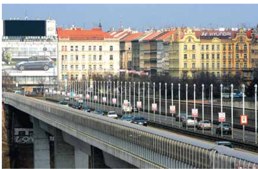
PROBLÉM HLUKU je možné řešit i výstavbou protihlukových stěn.

„Velmi snadno, posunutím značky silnice pro motorová vozidla až ke Spořilovu, můžeme snížit rychlost na třídě 5. května na 50 kilometrů v hodině. Tím se hluk sníží o podstatně decibely. Další, už náročnější řešení by mohlo přijít při opravě magistrály, kdyby se upravil povrch, což by ubralo dalších asi deset decibelů hluku,“