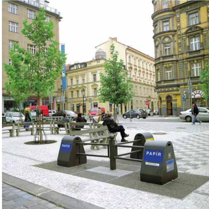
ODPOČINKOVÁ PLOCHA v centru Prahy.

Oživení dané lokality, v níž, pro centrum Prahy docela neobvykle, zůstalo zachováno výraznější soustředění bytů na úkor zastoupení obchodních a dalších komerčních aktivit, se po úpravách bezprostředního okolí gotického trojlodního kostela sv. Petra v r. 2005 soustředilo na zbytek náměstí. Druhá etapa proměny tedy zahrnovala úpravy právě centra Petrského náměstí. Je sice uprostřed souvislé zástavby rušného středu metropole,